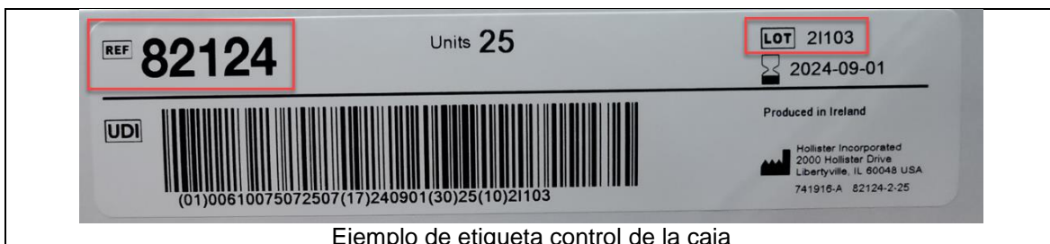
Ejemplo de etiqueta control de la caja